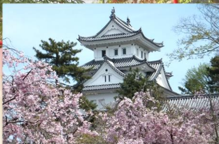
大垣城 Ogaki Castle