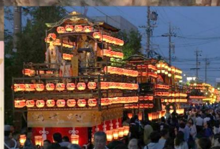
大垣祭 Ogaki Festival

It is a station of JR Tokaido Line, Yoro Railway and Tarumi Railway. It takes about 10 mins to Gifu station, and takes about 30 mins to Nagoya station.